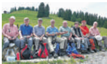
Picknick: Acht Männer auf einer Bank.

Trotz Sommerferien und vielen Abwesenheiten trafen sich am Freitag, 15. Juli, acht Männerriegler bereits um halb sechs am Morgen an der Tramstation Arlesheim. Zug/Bus und Gondelbahn brachten uns auf die Bergstation Wispile bei Gstaad, wo nach einer kurzen Kaffeepause unsere Wanderung auf dem Bergkamm bei Sonnenschein Richtung Süden via Vordere und Hintere Wispile