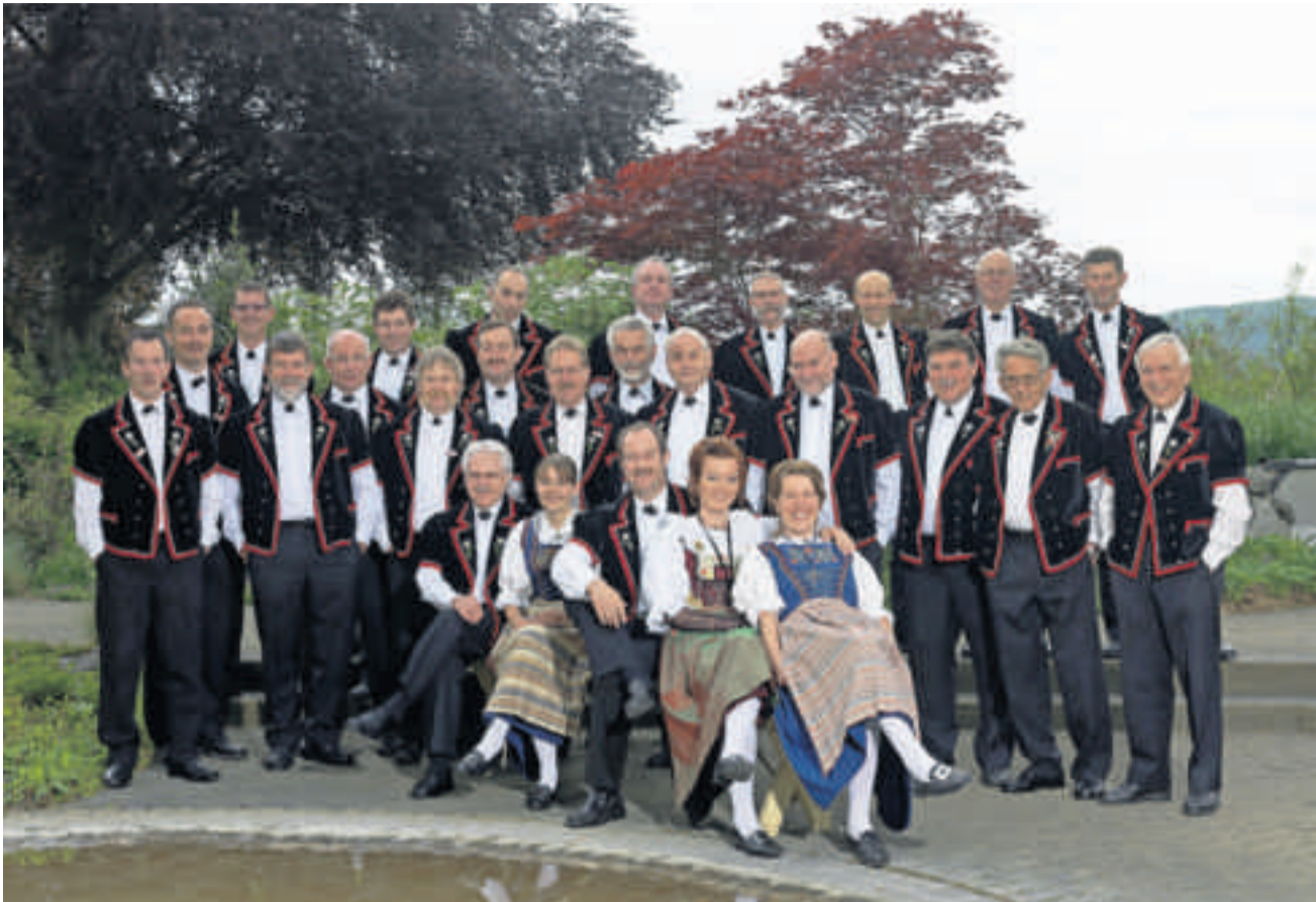
Jodlerchilbi in der Rynacher Heid: Auch der Jodlerklub «Echo» aus Reitnau macht seine Aufwartung.